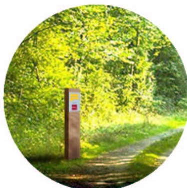
Poteau de balisage changement de direction