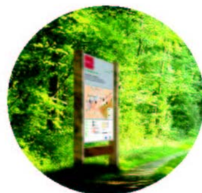
Panneau d'information vertical ou horizontal