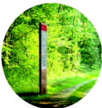
Totem d'information départ de circuit